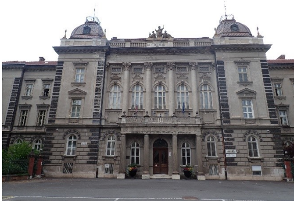
Budova rektorátu Univerzity Pavla Jozefa Šafárika v Košiciach na Šrobárovej ulici.

zastávke Krajský súd) alebo autobus č. 17 (vystúpiť na zastávke Hlavná pošta).