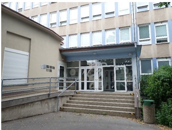
Vstup do RB budovy, miesta konania konferencie. (pozn. RB je označenie budovy v rámci rektorátneho areálu univerzity na Šrobárovej ulici)